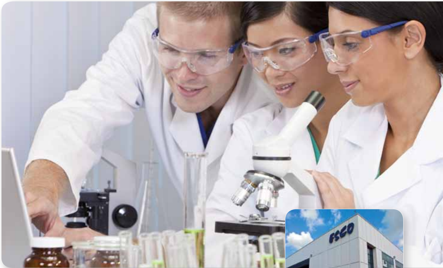
Photo : Le siège social d'Esco Micro Pte. Ltd est basé à Singapour, une cité-état moderne située dans le Sud Est asiatique comprenant une population de plus de 4 millions d'habitants. Depuis Singapour, Esco gère les opérations autours du monde