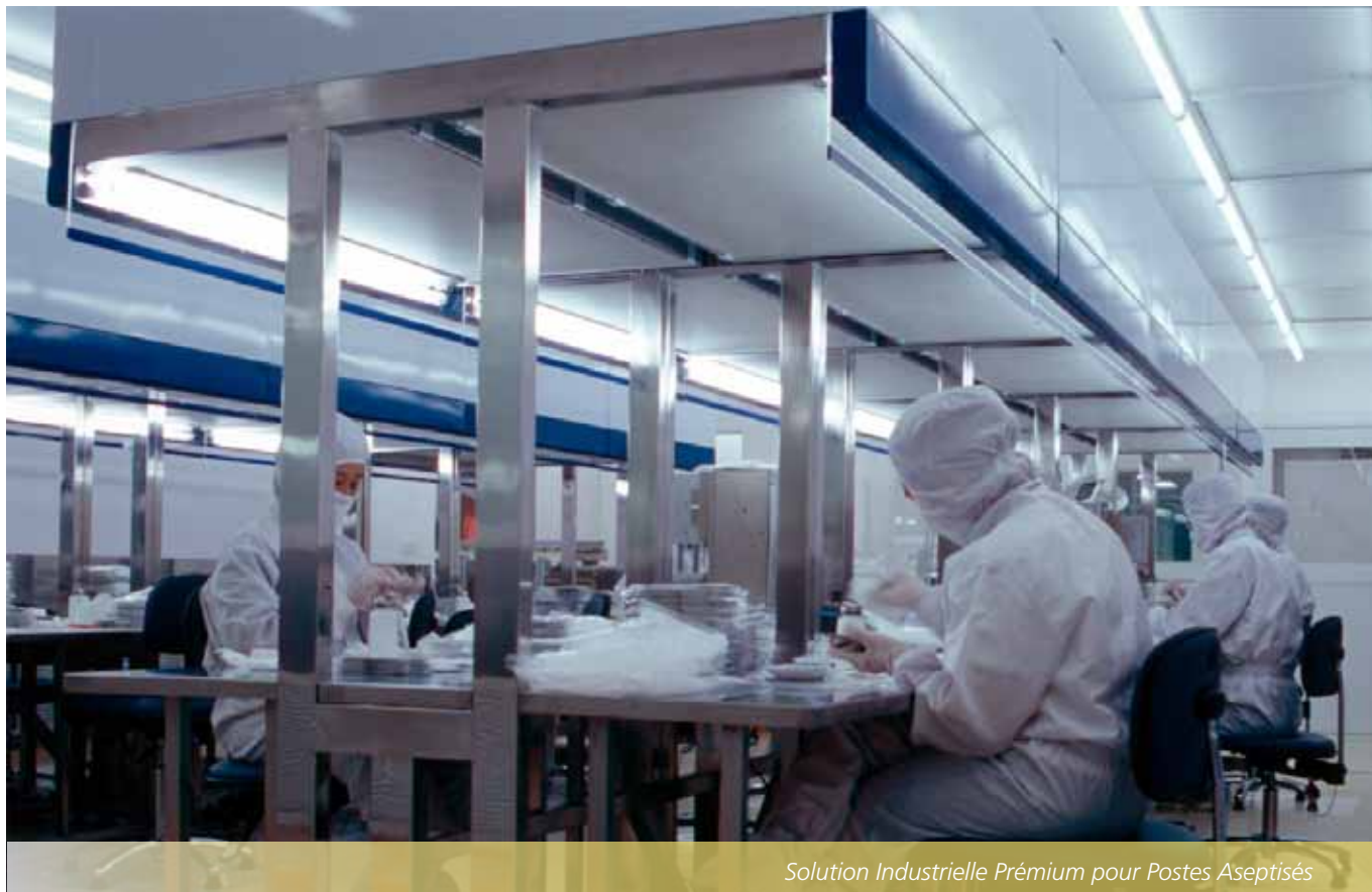
Solution Industrielle Prémium pour Postes Aseptisés

Esco est un des leaders de l'industrie dans le développement des hottes à flux laminaire de qualité professionnelle et sur mesure avec des dizaines de milliers de postes vendus à travers le monde.