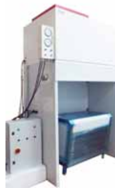
Cabine d'Essai Homologuée Atex.